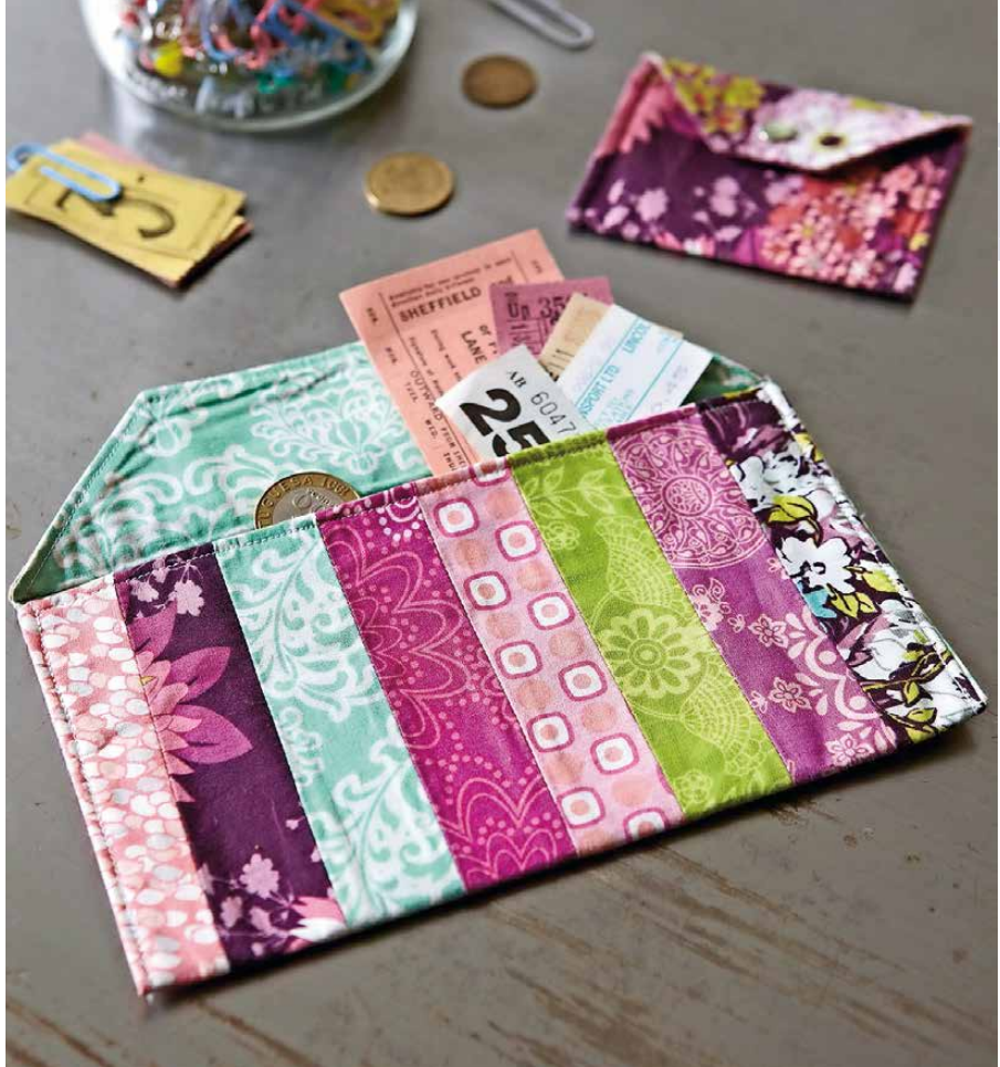
Für das gezeigte Design werden acht verschiedene Stoffe benötigt.

3 Das Bügelvlies entsprechend der Gebrauchsanweisung des Herstellers auf die Rückseite des Blocks aufbügeln. Für später zur Seite legen.