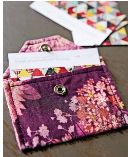
Die kleinen Täschchen sind hübsch und praktisch. Ideal, wenn Sie ein kleines Geschenk suchen!