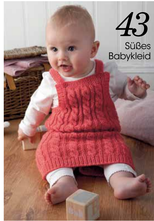
43 Süßes Babykleid