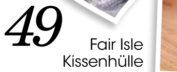
49 Fair Isle Kissenhülle