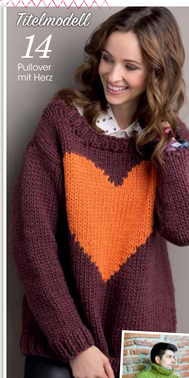
Titelmodell 14 Pullover mit Herz