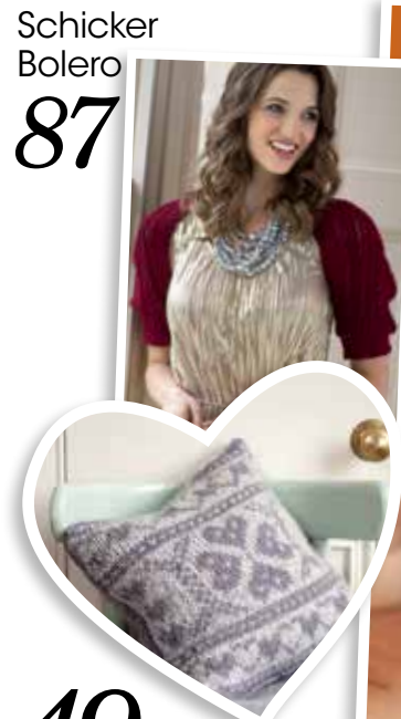
Schicker Bolero 87