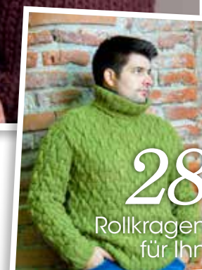
28 Rollkragen für Ihn