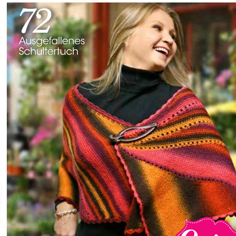
72 Ausgefallenes Schultertuch