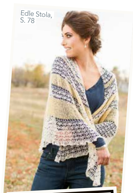
Edle Stola, S. 78