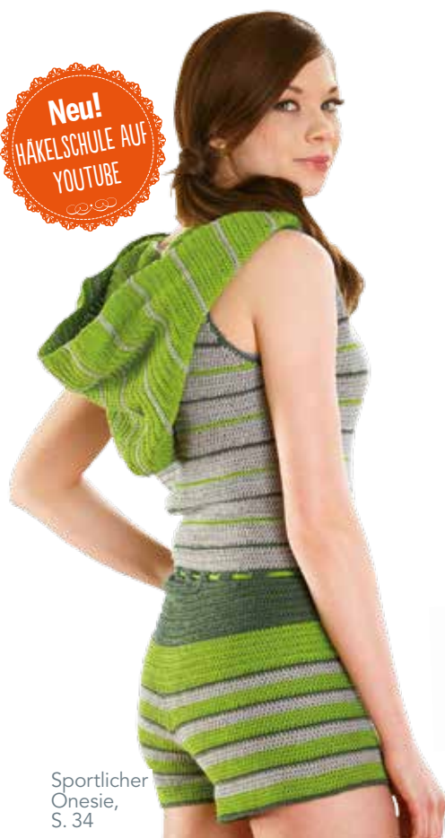
Sportlicher Onesie, S. 34