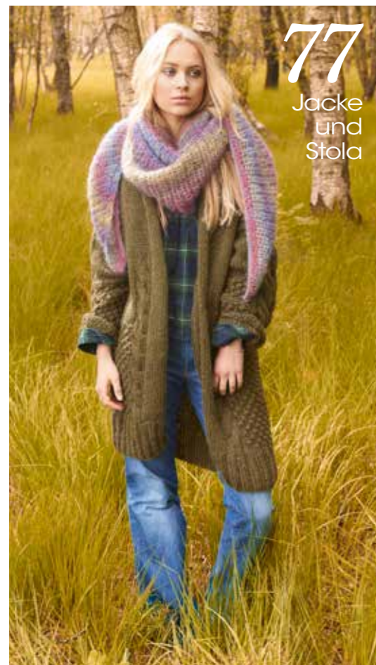
77 Jacke und Stola